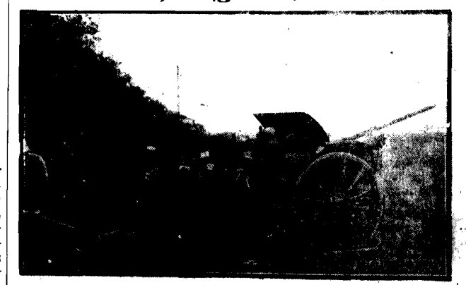
Lekkie baterje artylerji w ogniu w czasie manewrów armji niemieckich w Döberitz.